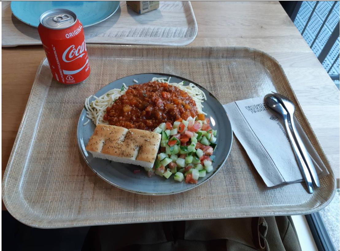
↑學生餐廳的義大利麵