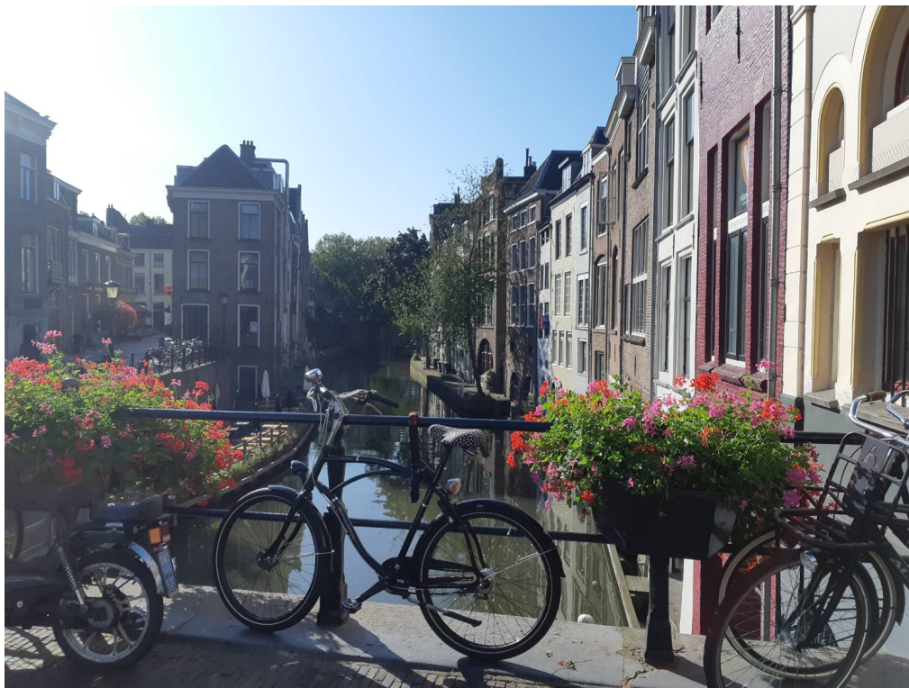
↑荷蘭第4大城市-烏特勒支